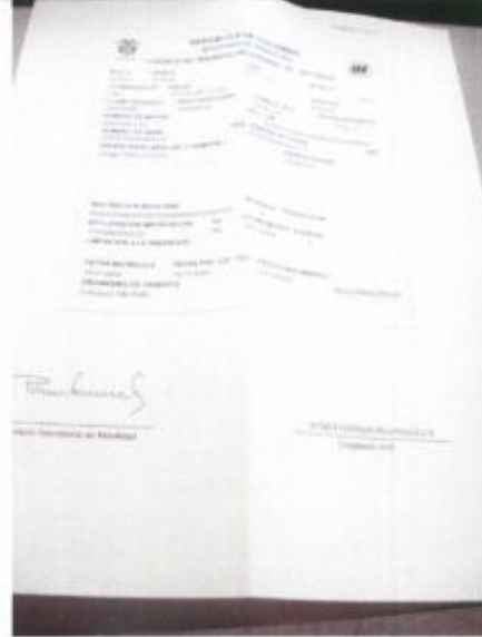
Licencia de tránsito