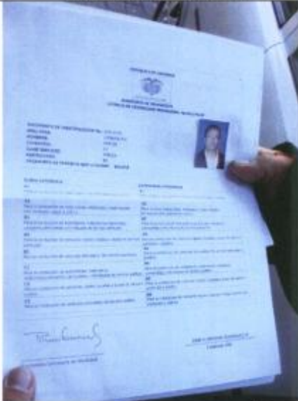
Licencia de conducción