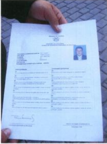
Licencia de conducción